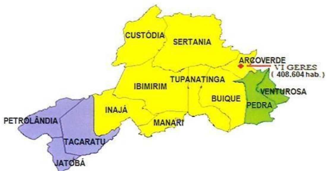
MAPA - 01

A UPAE Arcoverde iniciou suas atividades assistenciais em 30 de março de 2014 com sede no município de Arcoverde da VI Região de Saúde, sendo referência para 13 municípios (Arcoverde, Buíque, Custódia, Sertânia, Ibimirim, Inajá, Jatobá, Manari, Pedra, Petrolândia, Tacaratu, Tupanatinga, Venturosa). Os pacientes serão regulados pela VI Geres, totalizando uma população de aproximadamente 408.604 mil habitantes (DATASUS, 2014).